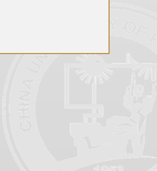
表3：《科研用房信息》院长签字